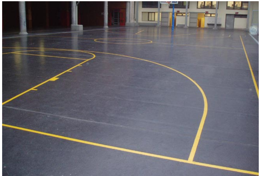
Colegio de los Padres Escolapios en la calle Henao de Bilbao

El primer caso son dos cubiertas planas en un mismo colegio de enseñanza de los Padres Escolapios en la Villa de Bilbao. Ambas sirven de patios de juego, situándose en la cota