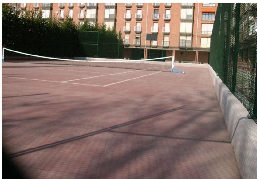
Cubierta sobre el aparcamiento de la Urbanización Florida II de Logroño

Impermeabilizar correctamente con asfalto fundido las cubiertas planas supone recuperar un espacio, que puede ser aprovechado para la creación de zonas de juego para la práctica de deportes o lugares de ocio para el disfrute de los vecinos.